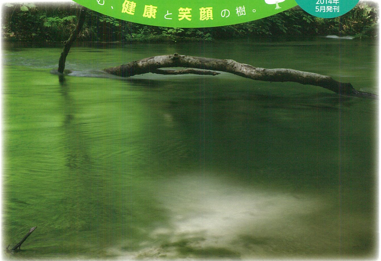
(撮影場所／奥入瀬)