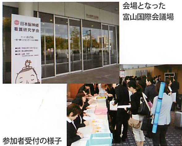
会場となった富山国際会議場