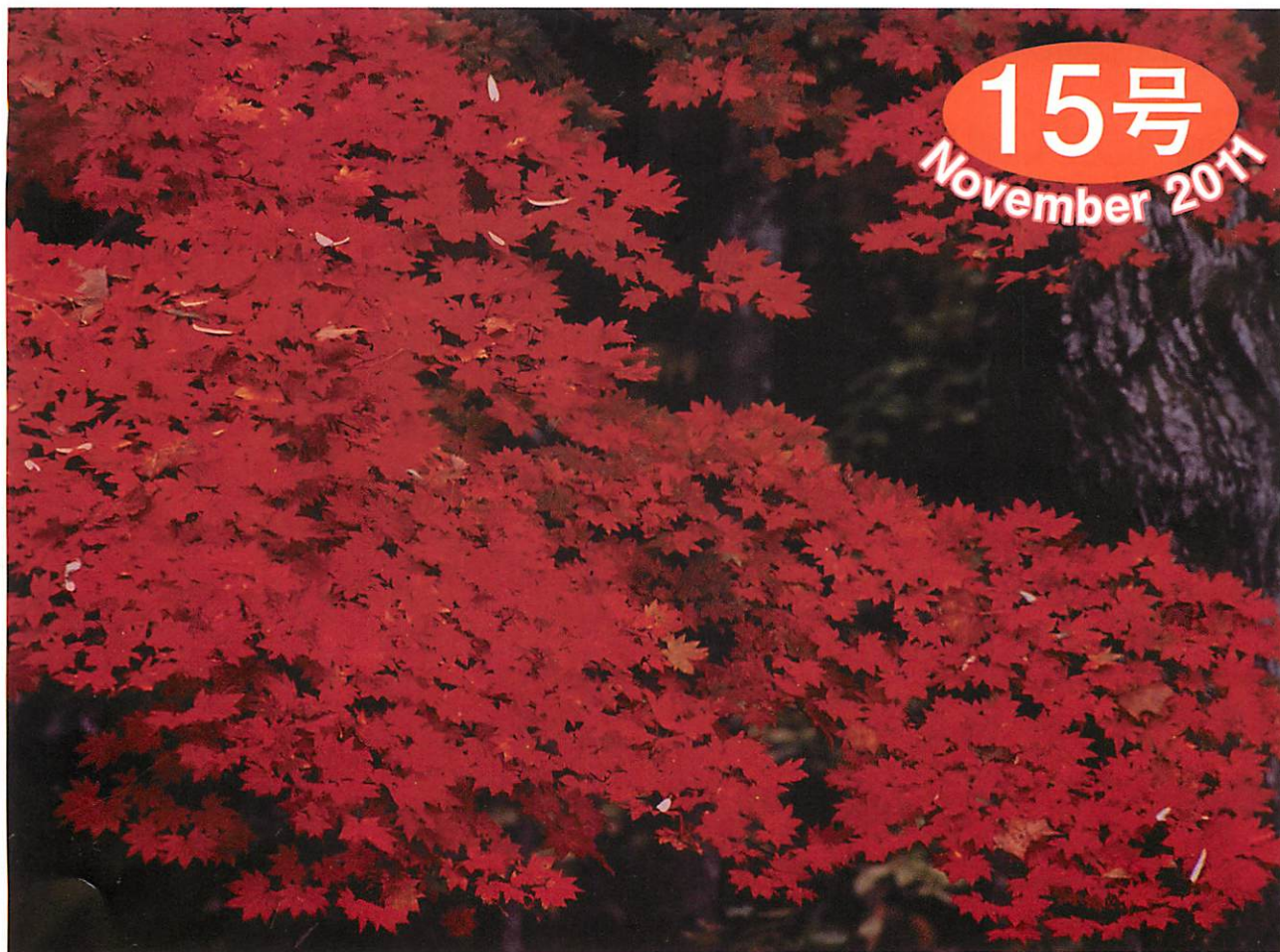
このひと時 (裏磐梯)