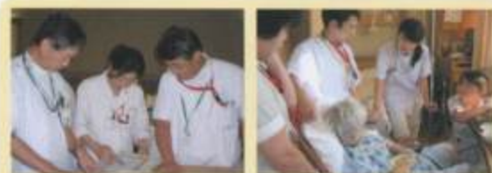
NST(栄養支援チーム)回診