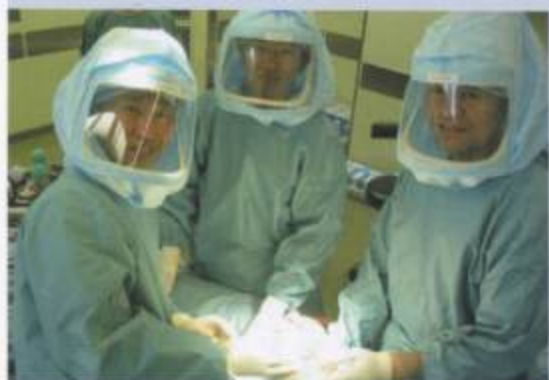
人工関節置換術での宇宙服を着た手術