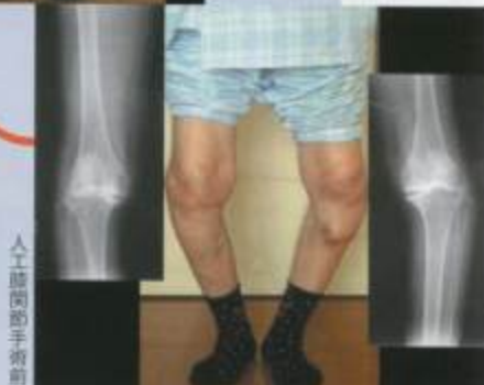
人工膝関節手術前