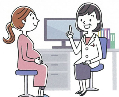
産婦人科 外来担当表